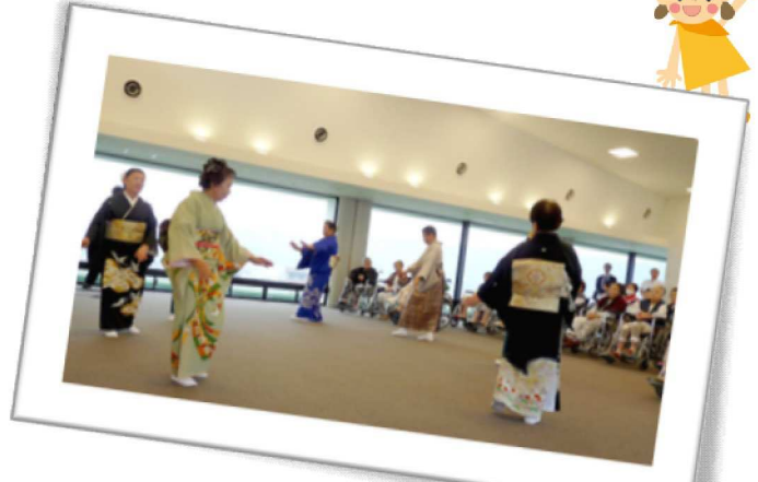
『寿枝房会』の皆様による日本舞踊(平成25年1月13日開催)