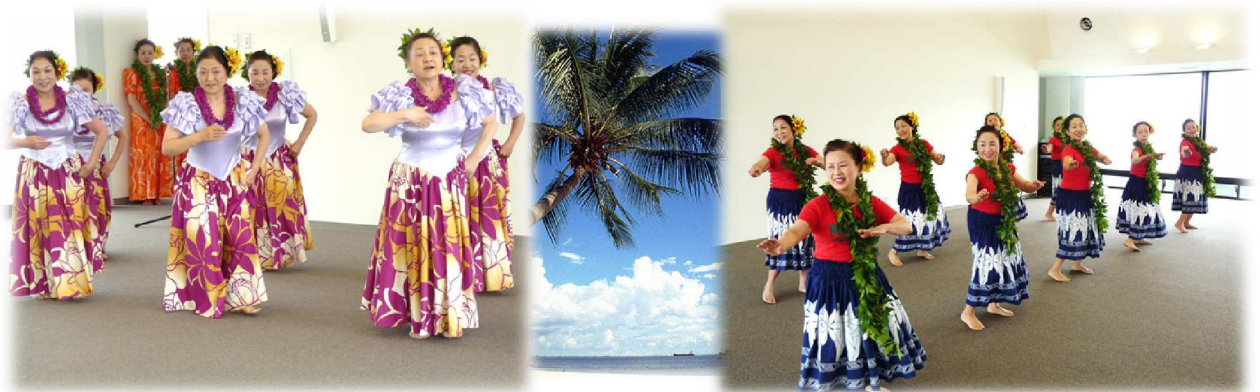
フラダンスサークル『ハーラウ・フラ・オ・カレオ・マルヒア』の皆様(平成25年3月17日開催)