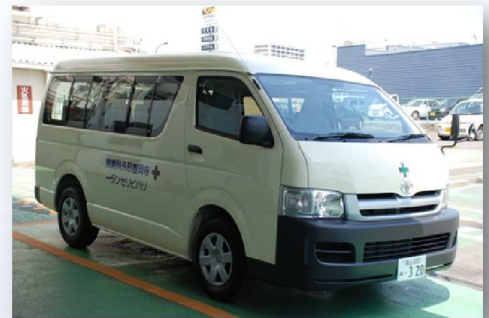
病院シャトルバス